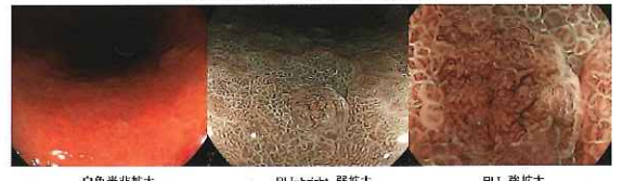
図4. BLIで発見した早期胃癌 (BLI-brightとBLI)

ザー内視鏡システムであるLASEREOシステムを市場展開しています。図4.は体中部小彎の早期胃癌の白色光、BLI-bright、BLIの非拡大観察と強拡大観察像です。これらの方法は拡大観察との併用で腫瘍表面の微細血管と表面構造の強調を可能とし、消化管早期癌の範囲診断に有用と期待されています。さらにLASEREOシステムは、その観察光の明るさからルーチン検査においても消化管癌の早期発見に有用であり、さらにレーザー光源の特性から、炎症の評価など通常の内視鏡観察では困難であった機能性診断の面でも今後の発展が期待できます。当院では4月からオリンパス社ELITEシステムが稼働し、7月には特殊機能を備えた最新の富士フィルム社LASEREOシステムが設置される予定です。これにより、上下部内視鏡検査はルーチン検査から癌の精密検査、Hp感染やIBDに代表される炎症の評価などが可能となります。形態診断と機能性診断をあわせて「見えないものが視えてきた！」と表題にしました。次号では、内視鏡治療に伴う十分なインフォームドコンセントの重要性と患者さんにやさしい粘膜下腫瘍のLECS(腹腔鏡内視鏡合同手術)の有用性を報告させていただきたいと思