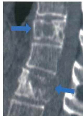
図1 骨転移による痛み 脊椎に溶骨性転移を認める。

緩和照射は、患者の症状を和らげ、生活の質を向上させることで、長期的な治療を継続するための環境を整えます。そのため、緩和照射は、がん治療において重要な役割を果たします。